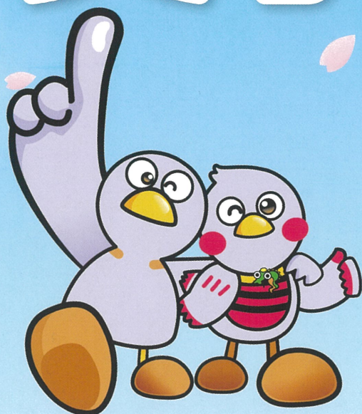
埼玉県のマスコット 「コバトン」・「さいたまっち」